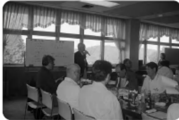
第45回ゴルフ大会 〈担当:総務委員会〉▶ (10月29日)