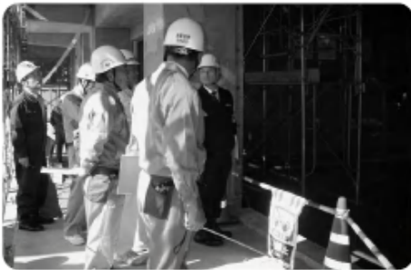
◀第1回合同安全/パトロール 〈担当:労務委員会〉 (11月26日)