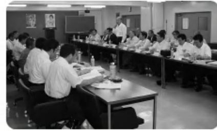
◀県下工業高校先生方との協議会 〈担当:研究開発委員会〉 (8月4日)