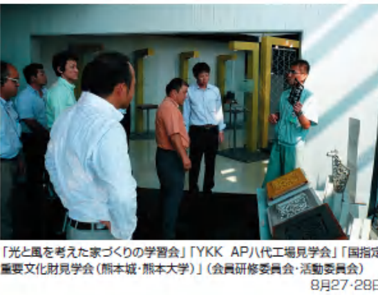
「光と風を考えた家づくりの学習会」「YKK AP八代工場見学会」「国指定重要文化財見学会(熊本城・熊本大学)」(会員研修委員会・活動委員会) 8月27-28日