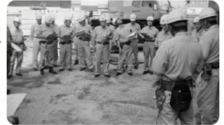
第2回労務委員会による▶ 安全/パトロール 〈担当:労務委員会〉 (8月26日)