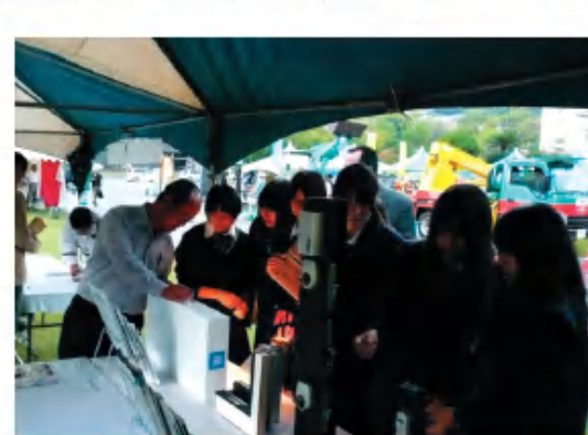
青少年育成事業(活動委員会) 10月26日

新年明けましておめでとうございます。活動委員長としまして、二年間通しての方針を「地域活性化と発展の為に、新しい分野への取り組みや、