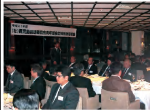
定時総会(総務委員会) 4月24日

新年明けましておめでとうございます。平成二十一年度の総務委員会の活動として定時総会・懇親会や会員手帳の更新、会報2000誌及び協会のよりの関係依頼・ホームページ掲載など様々な事業を行なってまいりました。今年度の残りの事業として、まして新年以降の青年部会理事役員を決める臨時総会を開催いたします。また、臨時総会と同日に青年部会会員相互の懇親会を開催し、懇親会を兼ねたレクリエーション・懇親会を開催いたします。そして、三月には2000誌の発行も行ないます。