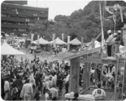
▼かしま住まいと建築展 上棟式 〈担当:工事委員会〉 (10月24・26日)