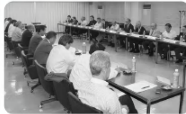
◀建築専門業団体との協議会 〈担当:研究開発委員会〉 (10月7日)