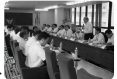
鹿児島県との協議会〈担当:総務委員会〉▶ (9月10日)