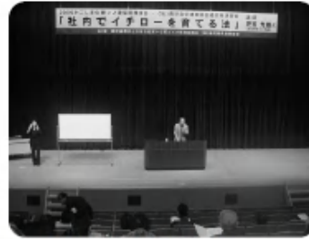
▲経営者講習会〈担当:総務委員会〉 (10月24日)