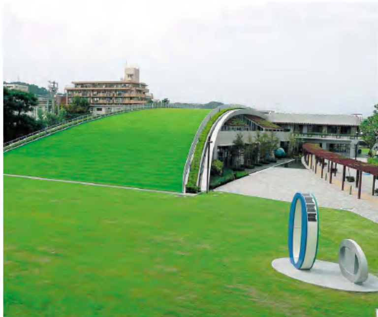
かごしま環境未来館(鹿児島市)

発行所 鹿児島県建築協会 鹿児島市城山町2-13 電話 099-224-5220 FAX 099-227-5479 http://www.kagoken.net/ E-mail: info@kagoken.net